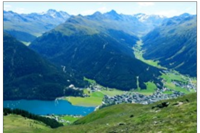
Ein herrliches Panorama, Davos mit See und Umgebung