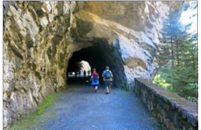
Wanderung auf der alten Strasse durch die Zügenschlucht