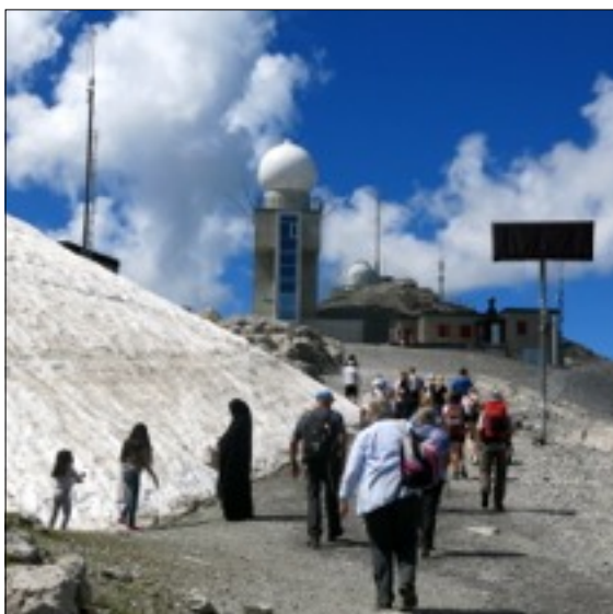
Weissfluh-Gipfel, Schnee- und Wetter-Station