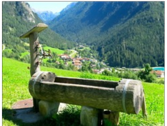
Filisur, Ziel der Wanderung am Samstag